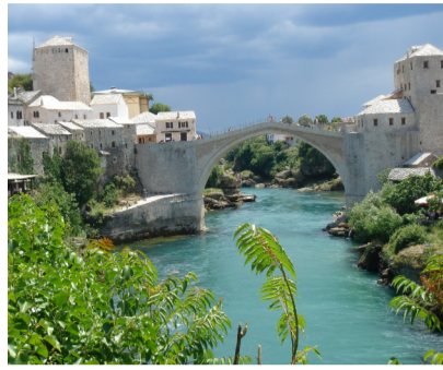
Brücke von Mostar.